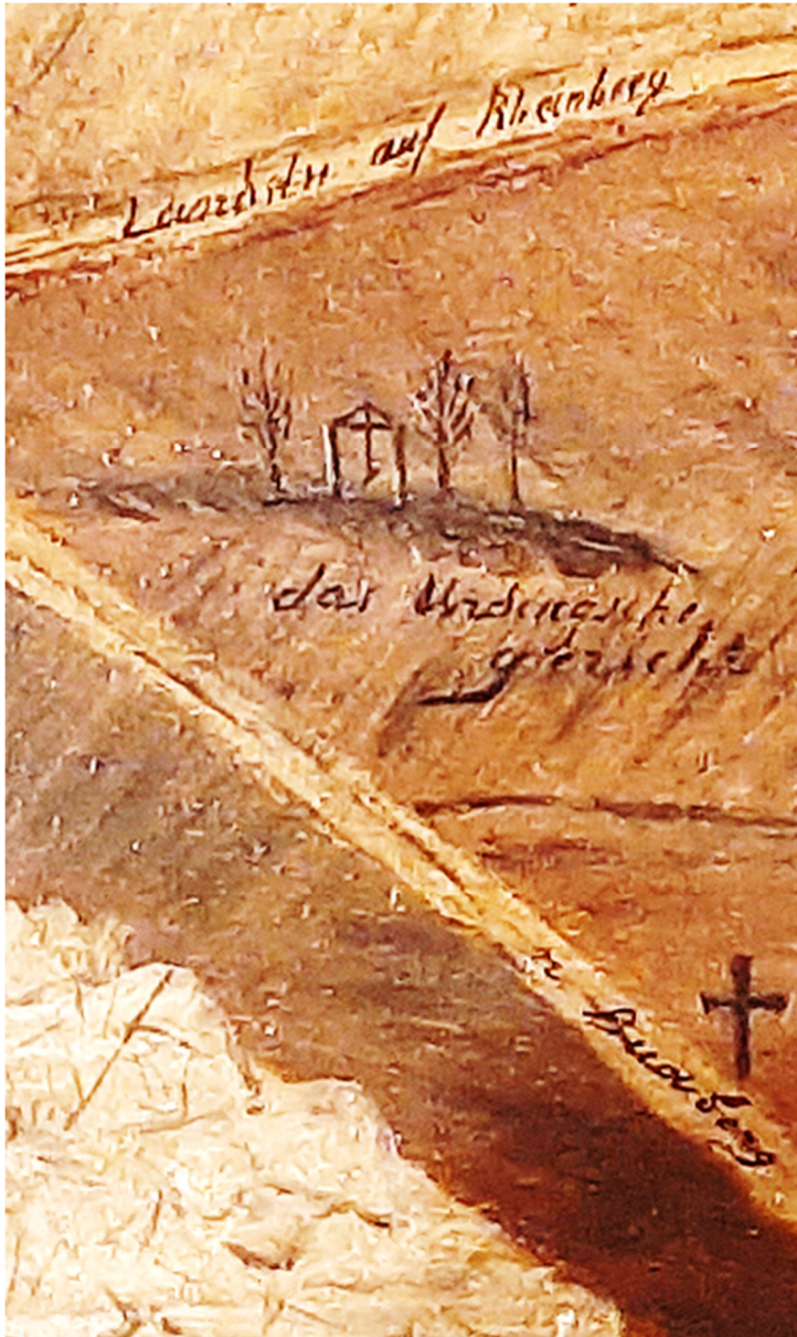
Ausschnitt aus dem Bild „Eisgang 18. März 1740“ Text: „Das Uerdingsche Gericht“

606. Montagslesung vor der Uerdinger Bücherei