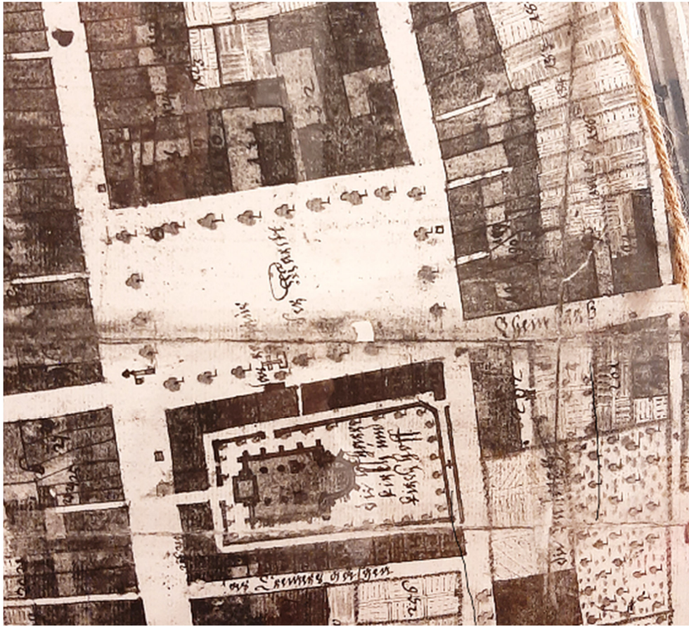
Der Blum'sche Stadtplan von 1724 unten: St. Peter und die Krämergasse rechts: „Rheinstraß“ (heute: Am Rheintor)